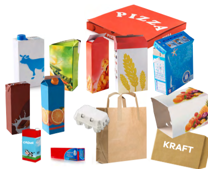
Cartons et briques alimentaires vides