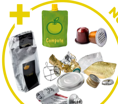
Capsules, sachets, boîtes, tubes, opercules, boules de papier aluminium